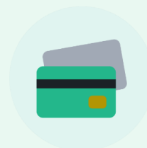
クレジットカード